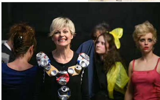
Photos (de g. à dr. et de haut en bas): Les Culturés: «A» - La Tropa dou Dzubyà: Mariadzo virtuel - Scènes ouvertes: Sound Off - Une expérience silencieuse - Les Enfants de la Rampe: Les Diablogues - Les Jouvenscènes: Théâtre sans Animaux - Tréteaux de Chalamala: Week-end en ascenseur - Intrè No: L'Eretadzo - Effectif Réduit: Ce que j'appelle oubli - Scènes ouvertes: La Catillon: Que la mer m'emporte - Le Nouveau Théâtre: Le Revizor.