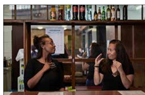
Avec des pièces de qualité et un public venu en nombre, les Rencontres théâtrales de Bulle semblent avoir déjà réussi leur retour.

JEAN-BAPTISTE MOREL / PIERRE-YVES PICHONNAZ